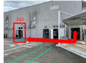
③ PCR 中心北侧入口