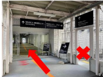
② 通往 PCR 中心正面入口·连接通道